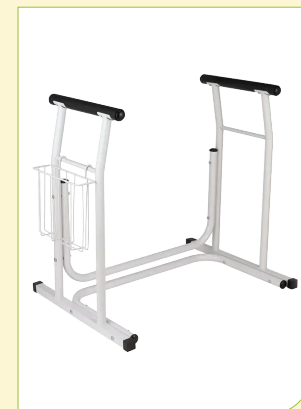
Podpěra k WC