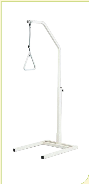
Hrazda k lůžku