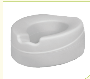
Nástavec na WC