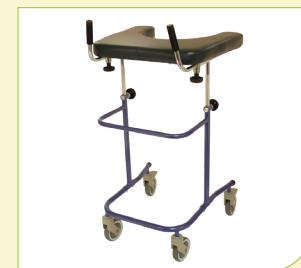
Vysoké chodítka s opěrkou