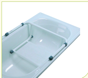
Sedačka do vany (s opěrkou)