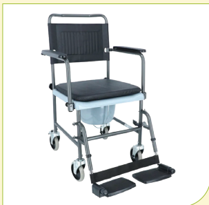
Křeslo klozetové (pojízdné)