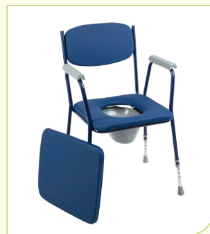
Křeslo klozetové (nepojízdné)