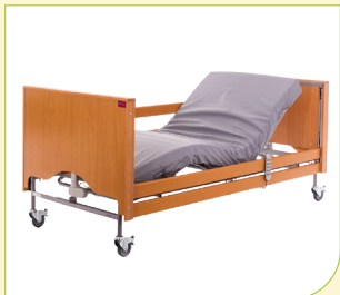
Elektrické polohovací lůžko včetně matrace