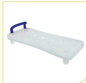
Sedačka na vanu (rovná)