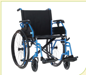
Invalidní vozík mechanický (skládací)