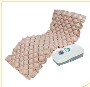
Antidekubitní matrace s pulzátorem