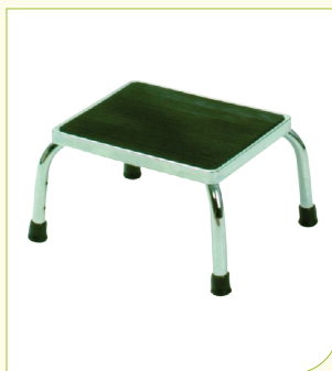
Stupínek k vaně