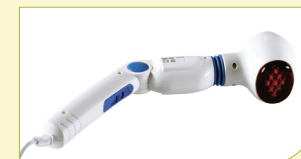
Ruční masážní přístroj (na celé tělo)