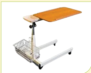
Polohovací stůl k lůžku (krmík)